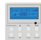
THERMOSTAT (Optionnel) XE71